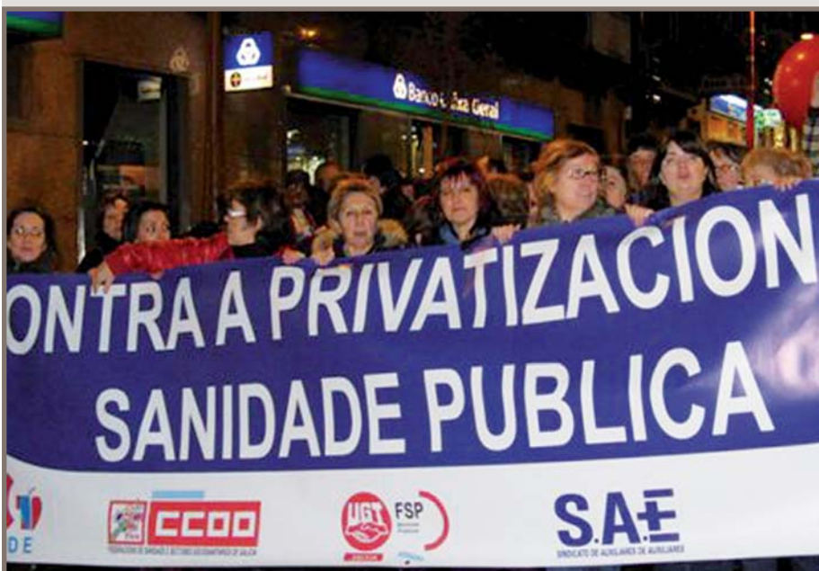
Instantánea da manifestación do pasado 25 de marzo

En resumo, o que a Xunta nos ofrece, e contra o que nós nos manifestamos —e seguiremolo a facer se non houber novidades positivas—, é un centro no que primará a busca de beneficios empresariais. Porque, non o esquezamos, calquera empresa privada centrará a súa xestión na maximización de beneficios, e coa sanidade non farán excepción ningunha. E se para maximizar beneficios cumpre recortar gastos, está claro que por onde poden comezar será pola redución de persoal médico, enfermaría, persoal técnico... en detrimento da calidade asistencial. E isto podémolo afirmar co aval das nefastas experiencias doutras comunidades como a valenciana ou a madrileña, onde tamén goberna o PP.