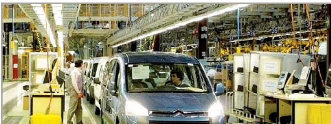
Imaxe da factoría de PSA-Citroën en Vigo

CCOO anunciou a súa intención de denunciar ante a Dirección Xeral de Emprego a situación que está a xerar a contratación a tempo parcial en PSA-Citroën, en Vigo. Un volume de case 3.000 persoas extinguiron a súa relación laboral con esta empresa nos últimos meses, atópanse con que, a pesar de efectuaren de xeito continuo unha xornada practicamente a tempo completo, con horas complementarias, estas non aparecen reflectidas nas súas cotizacións. «Unha situación de fraude», asegura Comisións.