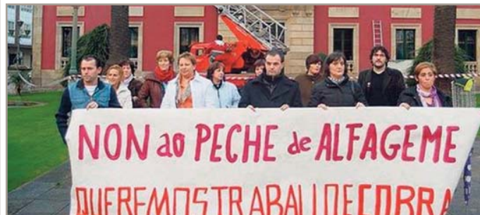
CCOO apoia as traballadoras e traballadores do grupo

A pesar das numerosas mobilizacións que tiveron lugar ata o momento, continúa sen haber unha solución satisfactoria para o persoal de Alfageme. Así as cousas, o pasado 25 de marzo, o grupo conserveiro solicitou o concurso voluntario ante o Xulgado do Mercantil de Vigo. Ante esta nova situación, CCOO reclama solucións, lembra que o persoal aínda non cobrou a nómina de febreiro e, previsiblemente, tampouco cobrará a de marzo, polo que continuarán as mobilizacións.