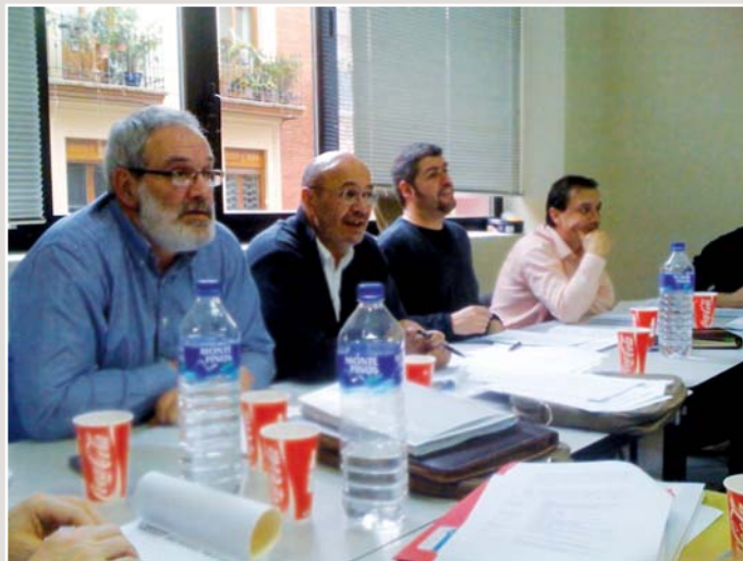
Na última semana de marzo reuniuse en Bilbao o Galeusca sindical, encontro dirixido polos secretarios xerais de CCOO de Galicia, Euskadi e Cataluña, e no que se falou sobre todo do diálogo social