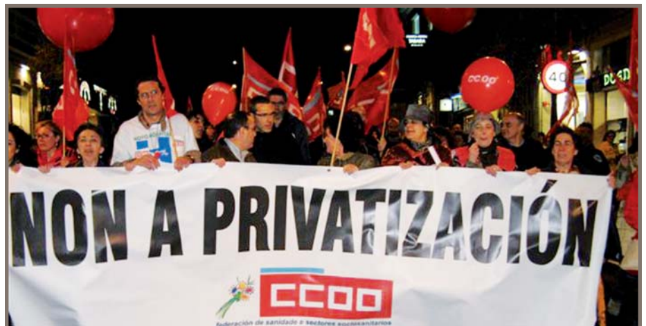
CCOO leva moitos anos a oporse á entrada de capital privado na sanidade

Comisións Obreiras lembra que o investimento privado deteriora a