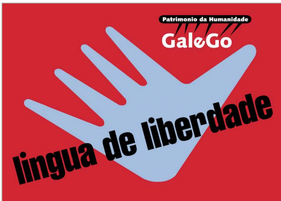
CCOO forma parte da plataforma Galego, Patrimonio da Humanidade