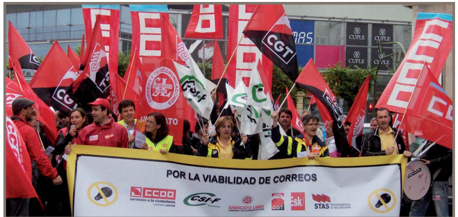
O persoal de Correos implicouse nos actos reivindicativos

O sindicato destaca a «ampla participación» das traballadoras e dos traballadores na xornada de folga, o que supón o «total rexeitamento» aos recortes económicos e de persoal que enmascaran unha «reconversión» de 1.000 empregos a curto prazo e 18.000 a medio prazo.