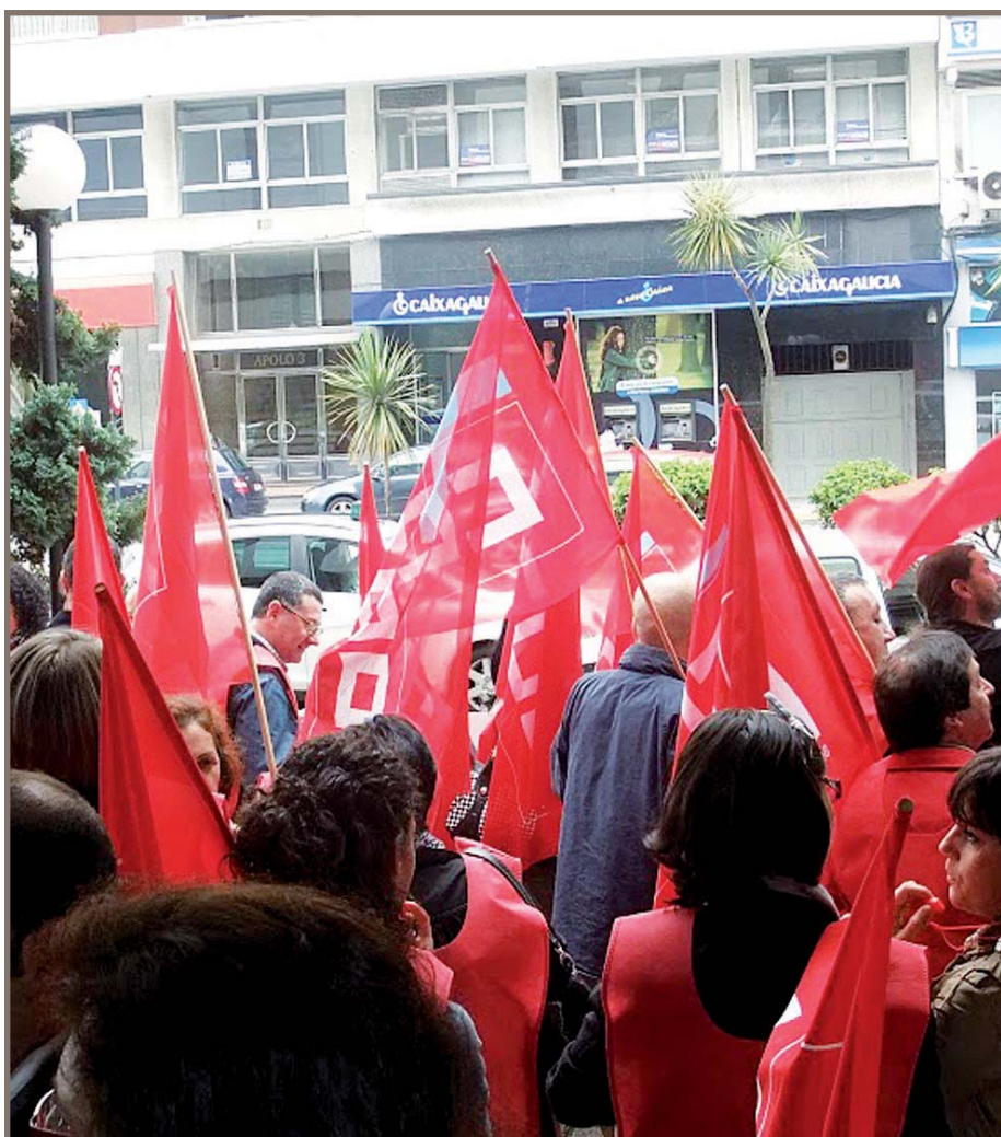
Na imaxe, unha das concentracións do pasado día 9 de xuño

Para CCOO, o máis preocupante é que empresas que tiveron e seguen a ter cuantiosos beneficios, «continúan escudándose na crise para que a paguen as traballadoras e traballadores».