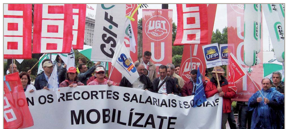
Imaxe da folga do sector público do pasado 8 de xuño

A primeira etapa do camiño andarémola a semana que vén coa manifestación que convocamos os dous sindicatos para o 30 de xuño en Santiago de Compostela.